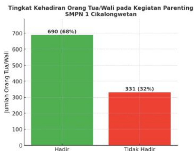
Gambar 1: tingkat kehadiran orangtua/wali

Berdasarkan data survei, tingkat kehadiran orang tua/wali pada kegiatan parenting di SMPN 1 Cicalongwetan mencapai 68% (690 orang) dari total 1.021 orang tua/wali, sementara 32% (331 orang) tidak hadir. Faktor ketidakhadiran didominasi oleh alasan bekerja dan sakit, diikuti kendala transportasi serta keperluan keluarga. Tingkat partisipasi ini dapat dikategorikan cukup tinggi, meskipun masih menyisakan tantangan untuk meningkatkan keterlibatan seluruh orang tua. Tingkat kehadiran orangtua/wali pada kegiatan parenting di SMPN 1 Cicalongwetan di sajikan pada Gambar 1 di bawah ini: